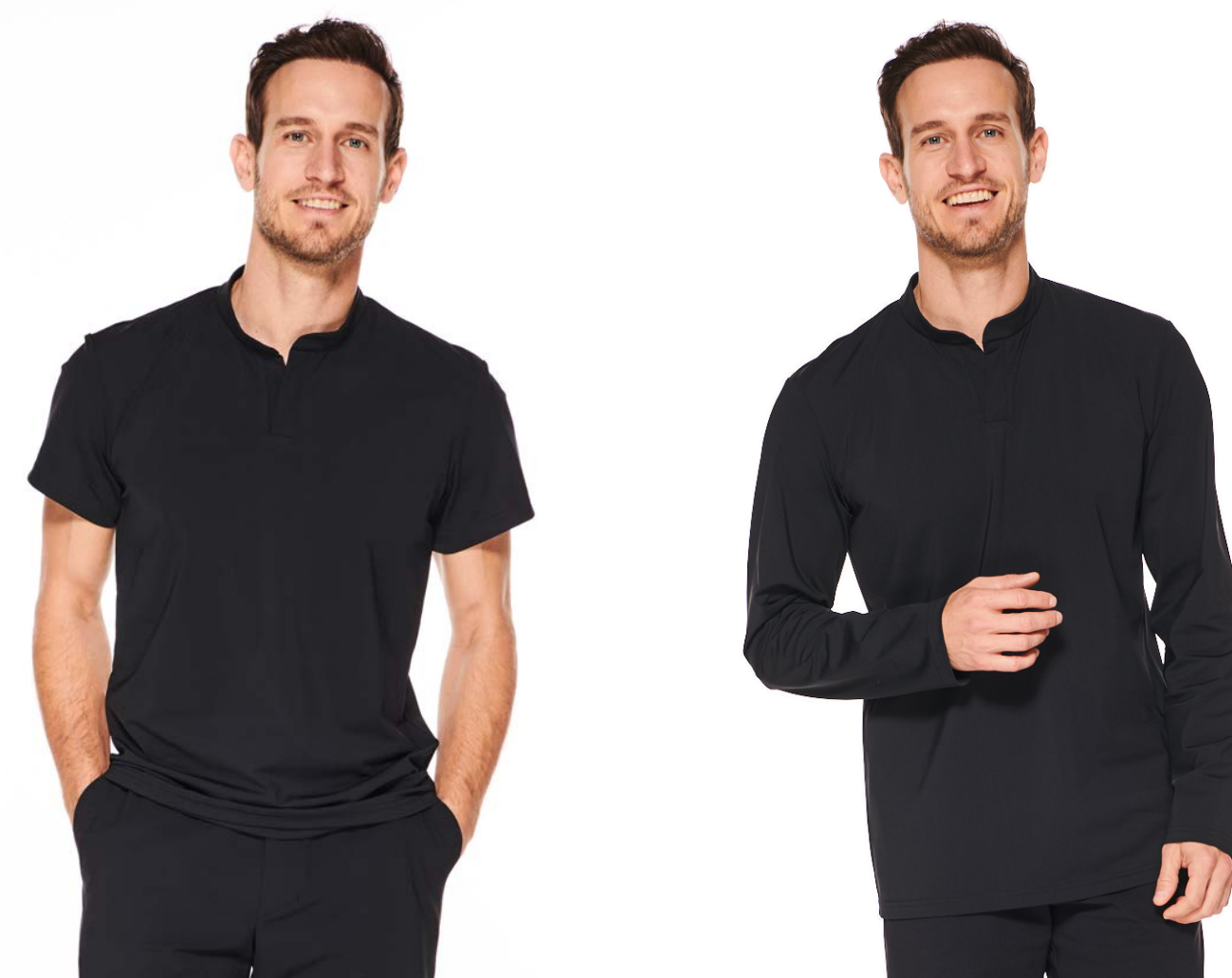
Shirt Lychee, Stehkragen, kurz-/langarm