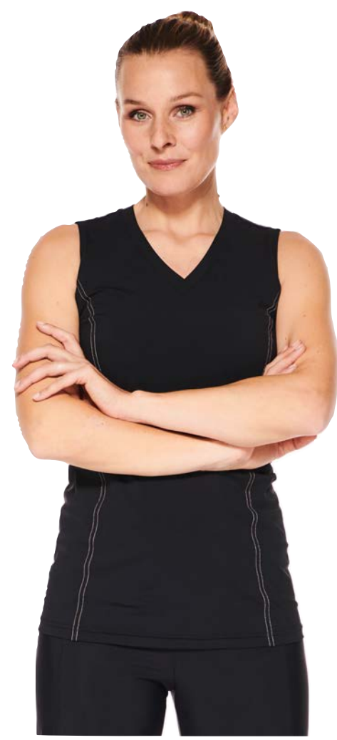
Top Serena, hüftlang, Polo lang-/kurzarm, Tops V-Ausschnitt kurz-/langarm und ärmellos