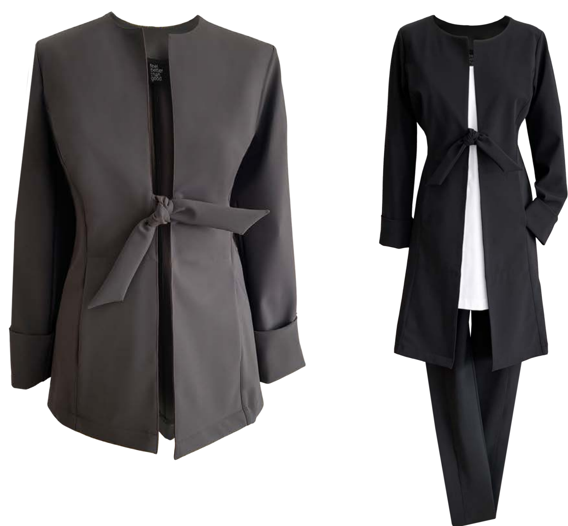
Chris mit seitlichen Taschen, hüft- oder knielang, Top Gelati, Hose Twiggy