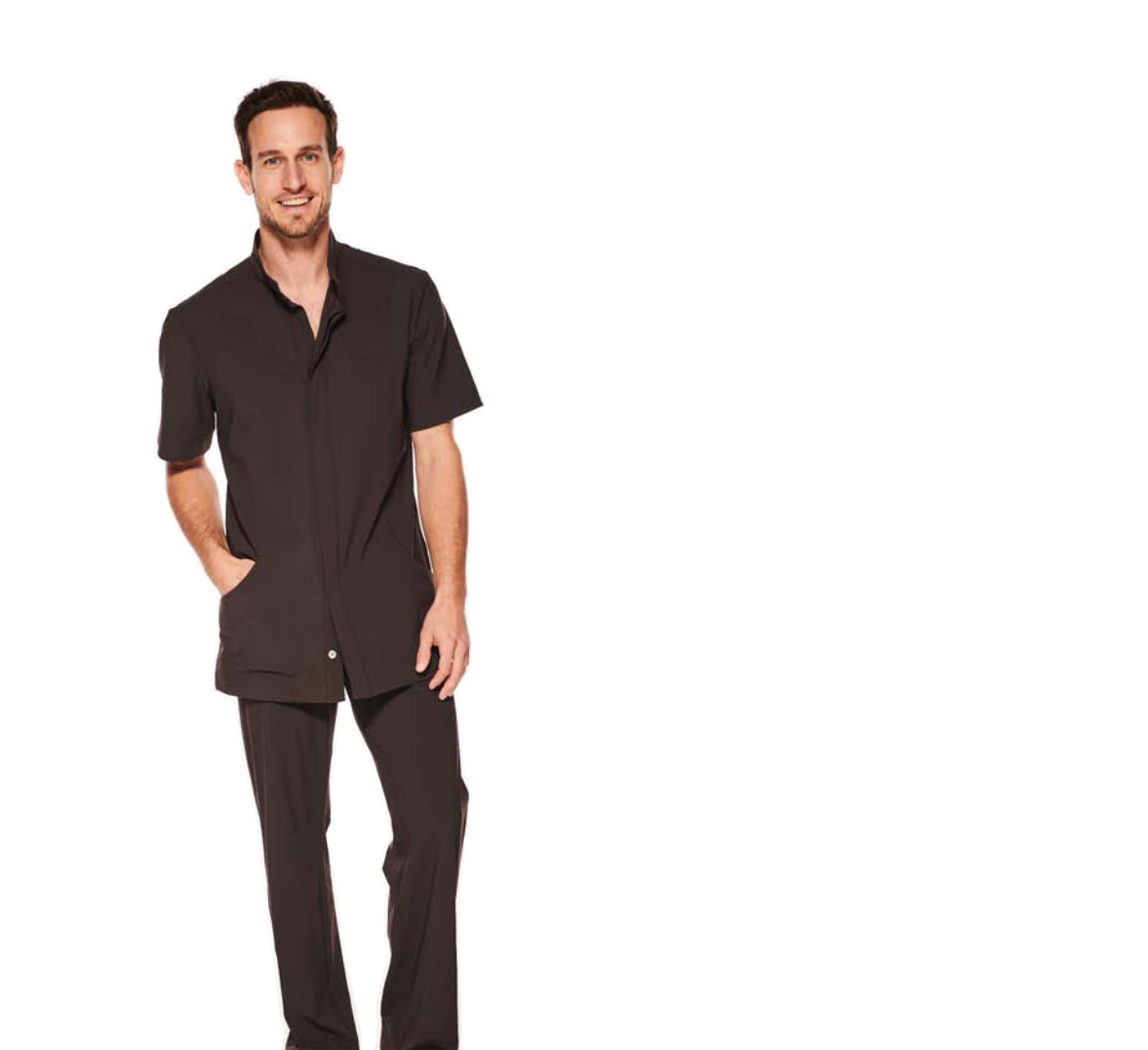
Shirt Peter, hüftlang, Stehkragen, Seitentaschen, Hose Basil