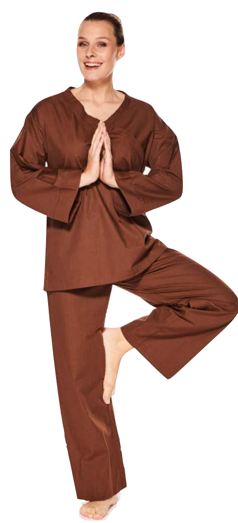
Shiatsu Set unisex für die Gäste