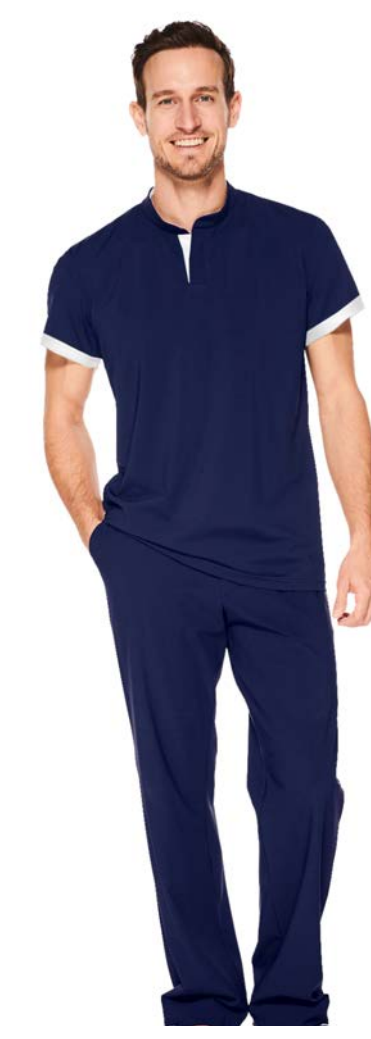
Shirt Lychee mit Stehkragen, Hose Cassis mit Seitentaschen