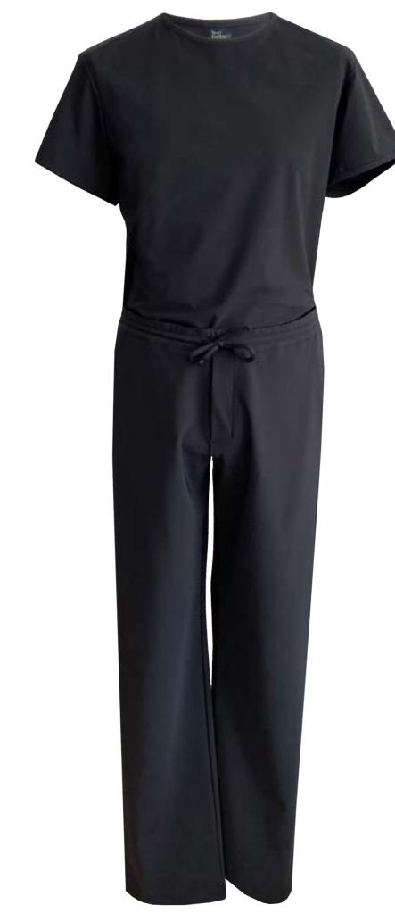
Shirt Sage, Hose Basil