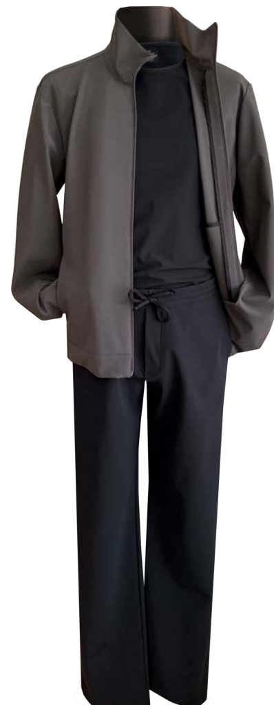
Sport-Blazer Julian, Reisverschluss, Stehkragen, Taschen, Shirt Sage, Hose Basil