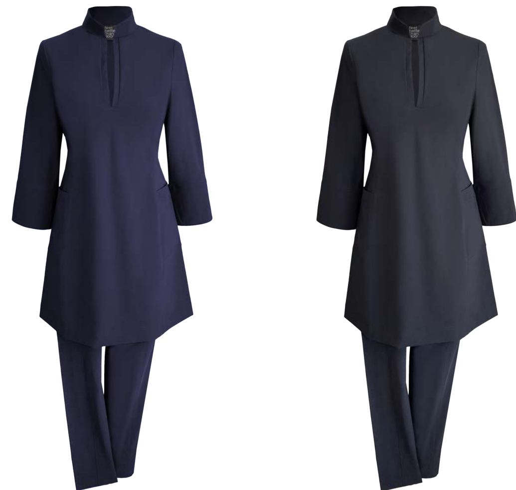
Tunica Lychee, 3/4-Arm, Stehkragen mit seitlichen Taschen, Hose Twiggy Capri