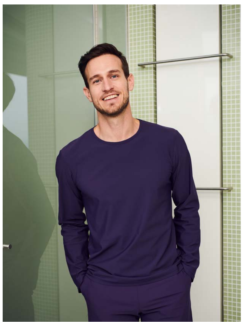
Shirt Jake kurz-/langarm, Hose Cassis