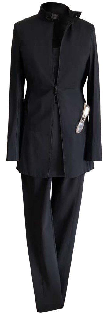
Biker Betsy hüftlang, Reißverschluss, Stehkragen, seitliche Taschen, Hose Twiggy