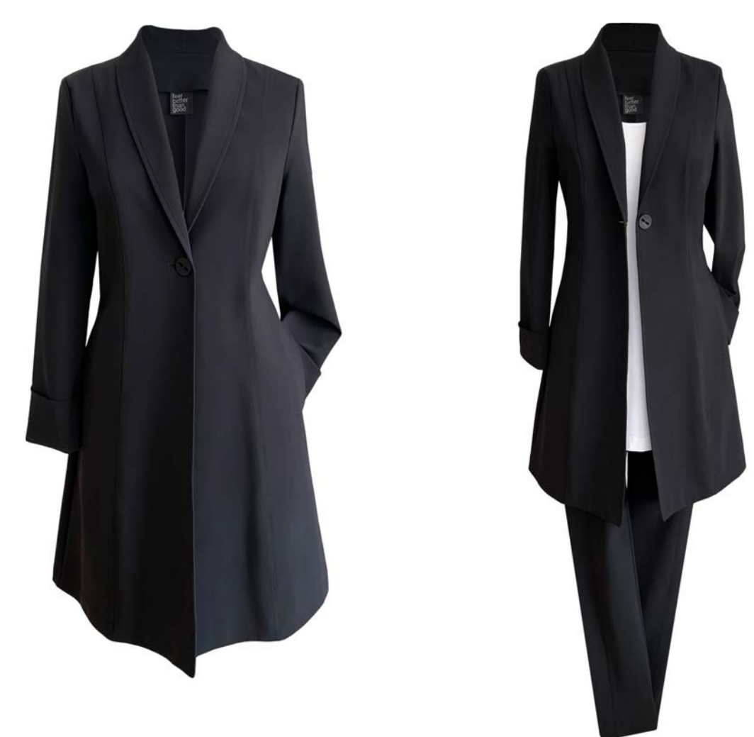
Long-Blazer Di mit Reverskragen, Mitte Oberschenkel lang, seitliche Taschen, Top Gelati, Hose Twiggy