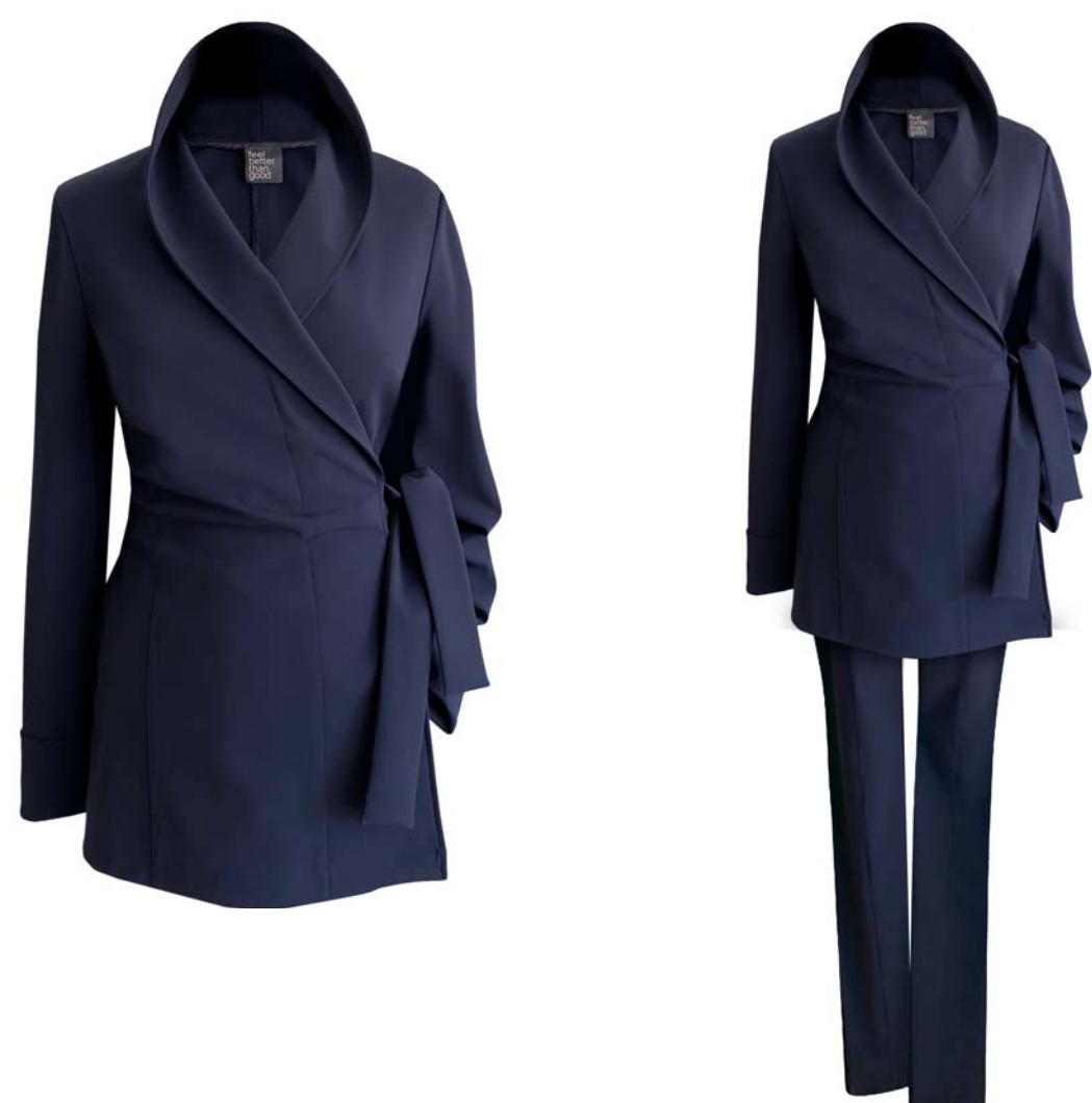
Wickel-Blazer Calla, hüftlang, Seitentasche, Hose Twiggy