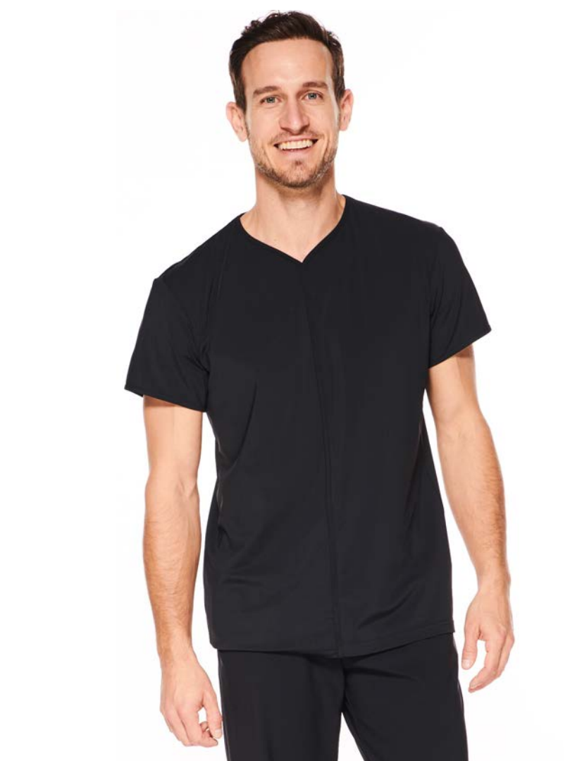
Shirt June kurz-/langarm, V-Ausschnitt