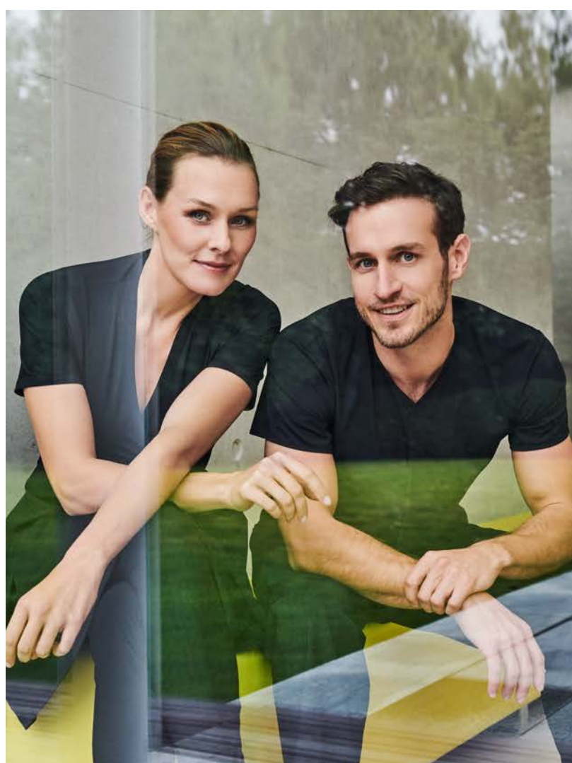
Tunica-Top June kurz-/langarm, Taschen, Mitte Oberschenkel oder hüftlang