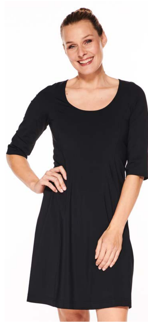
Tunica-Kurzkleid Luna kurzarm, Taschen