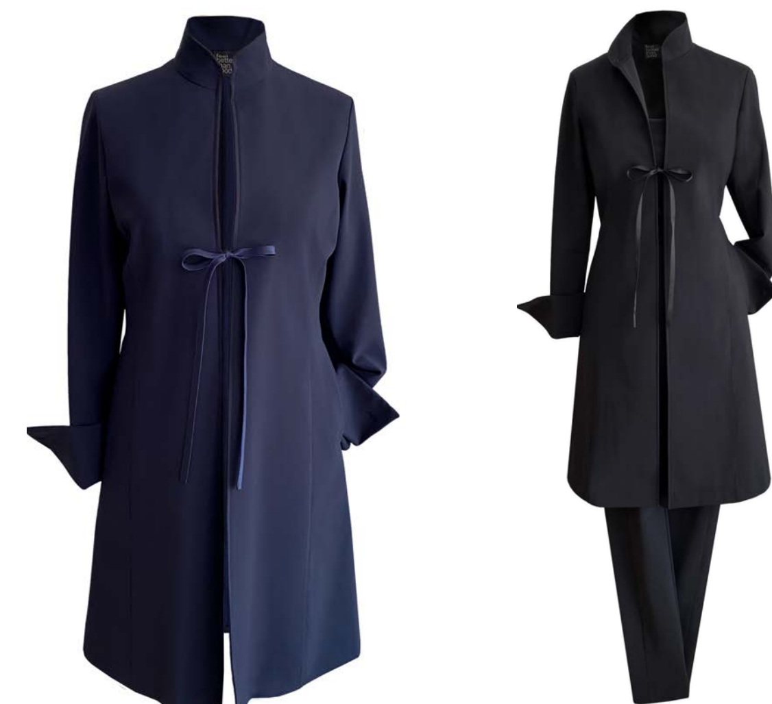
Blazer-Mantel Laurence, knielang, Seitentaschen, Top Gelati, Hose Twiggy