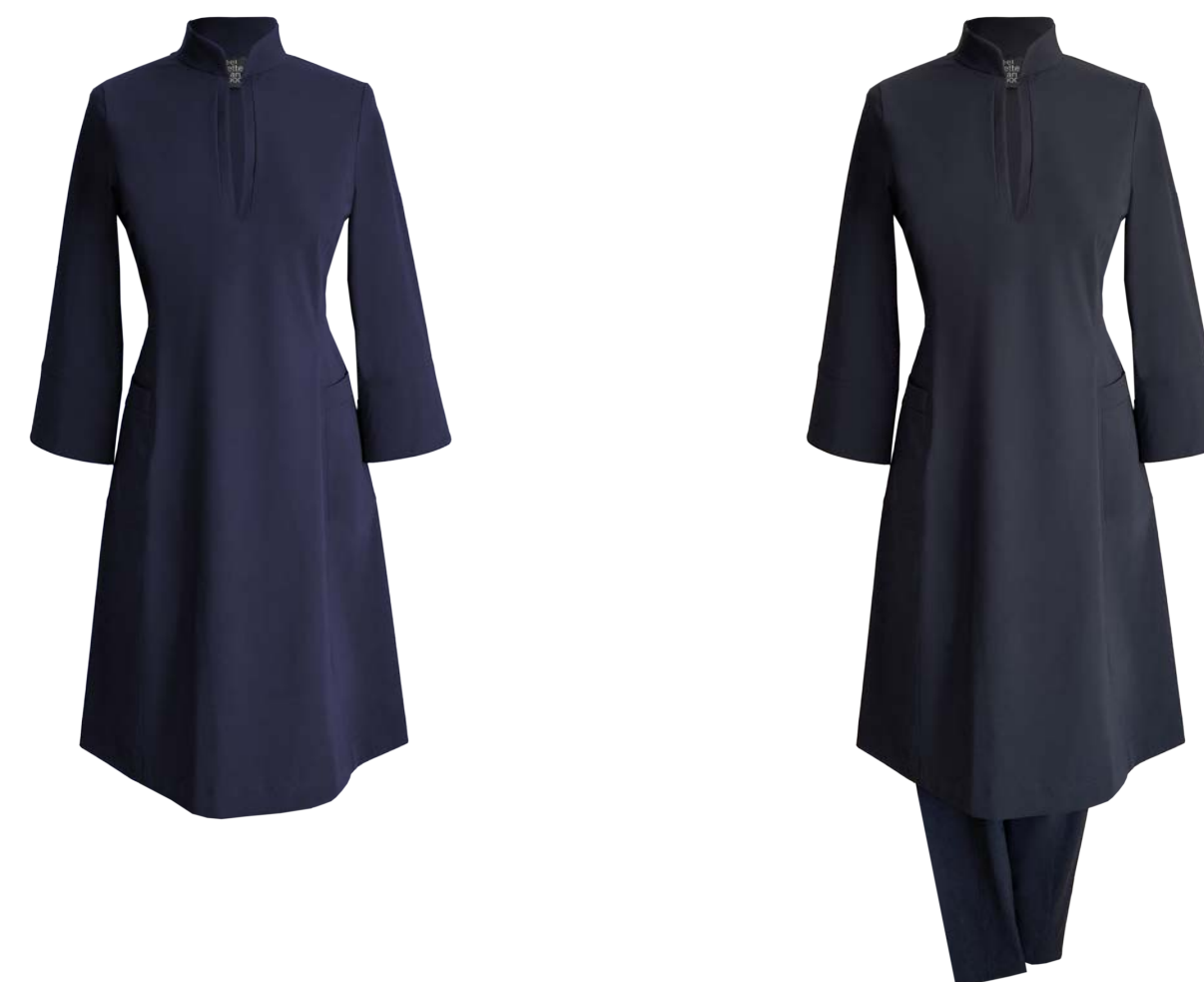
Kurzkleid Lychee, 3/4-Arm, Stehkragen mit seitlichen Taschen, mit oder ohne Hose Twiggy Capri