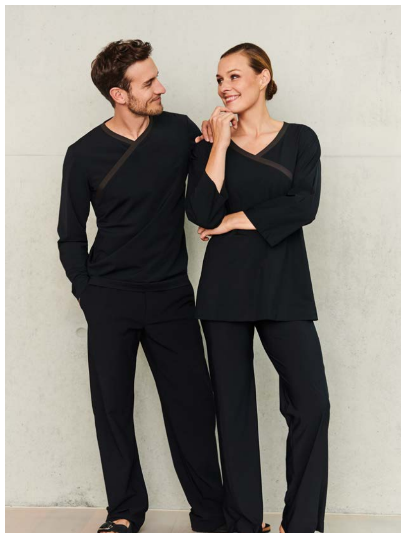
Tunica-Top Yin, hüftlang, 3/4 Arm, kurzarm, ärmellos