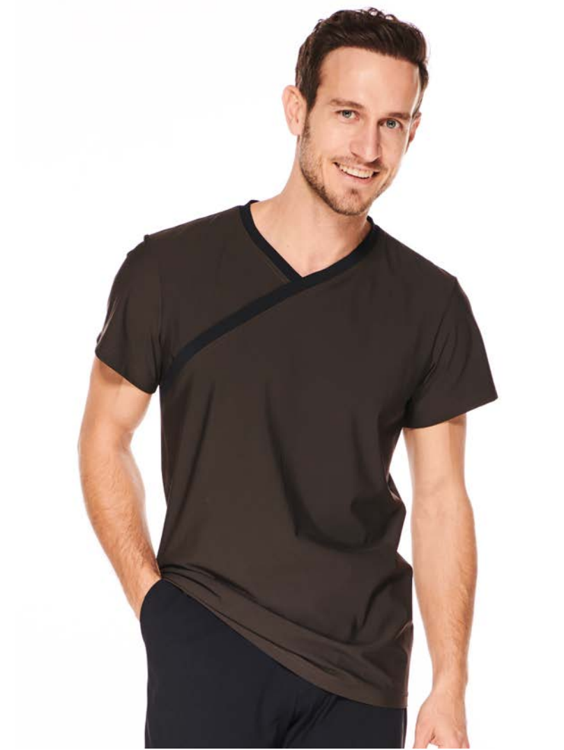
Tunica-Top Yang, kurz-/langarm