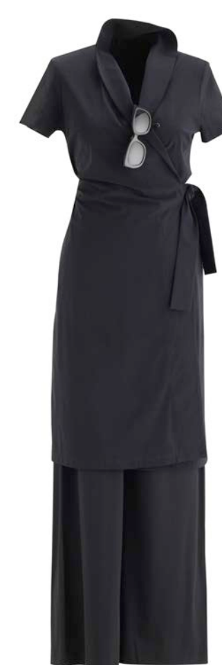
Wickelkleid Carina mit/ohne Hose