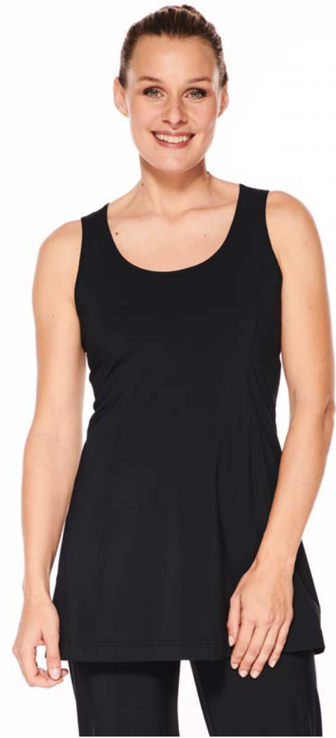
Tank-Top Luna hüftlang, ärmellos