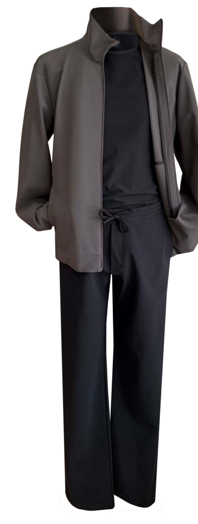
Sport-Blazer Julian, Reißverschluss, Stehkragen, Taschen, Shirt Sage, Hose Basil