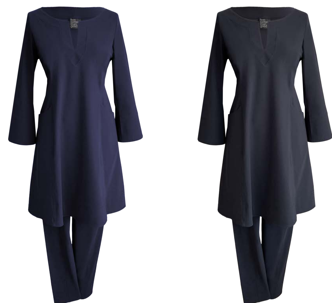
Tunica Jeanette mit seitlichen Taschen, 3/4-Arm, ausgestellt, Mitte Oberschenkellang, Hose Twiggy Capri