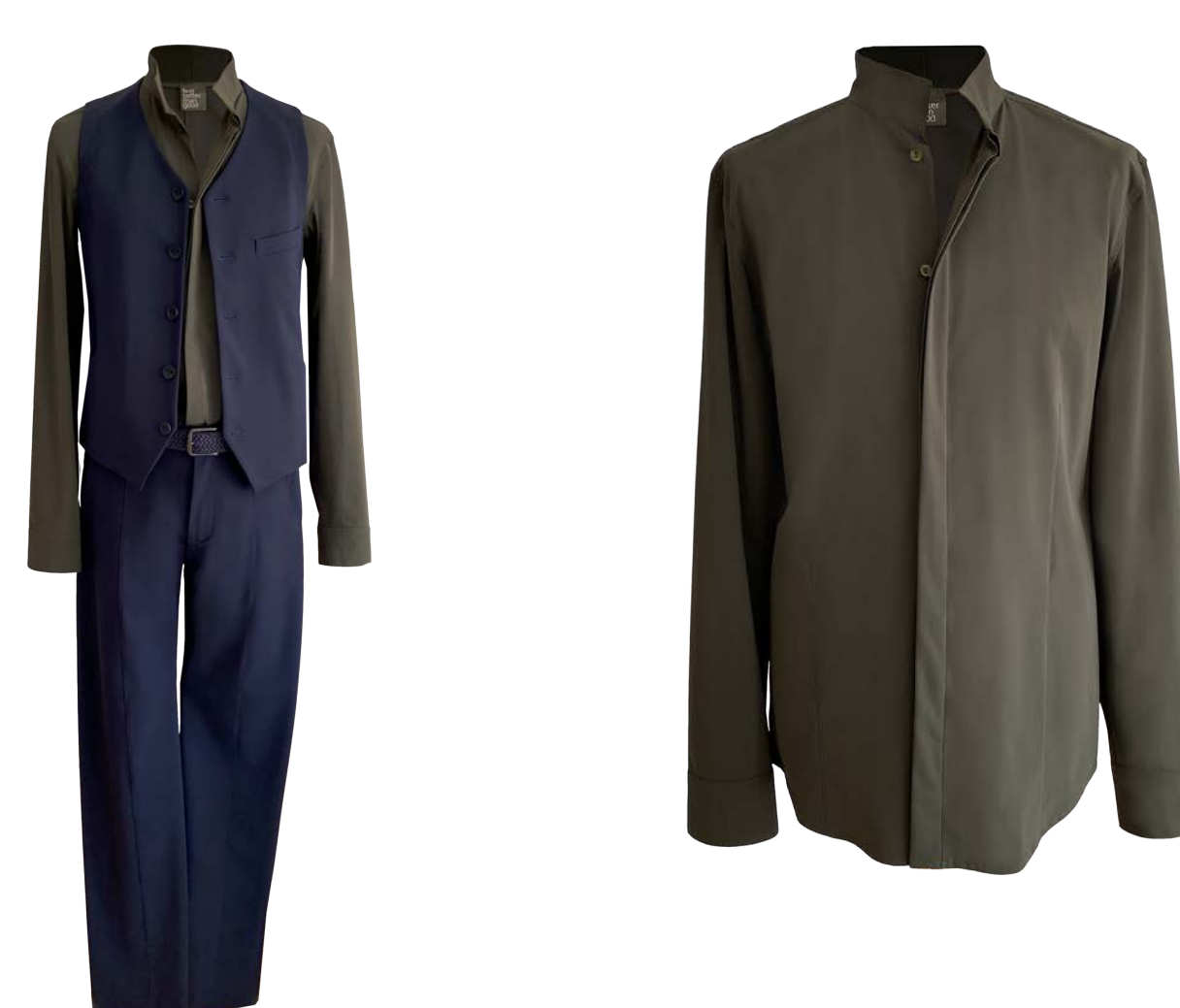
Gilet Gilbert, Stehkragen-Hemd Sam mit verdeckter Knopfleiste, Hose Blake