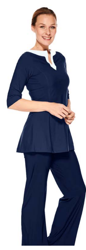
Tunica-Top Jasmine, hüftlang, seitliche Taschen, Hose Anais