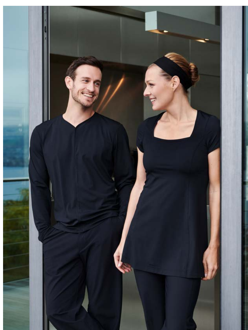
Top Ginger kurzarm, über-hüftlang, weite Hose Anais