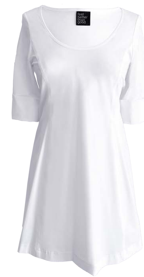
Top Gelati, ärmellos und kurzarm