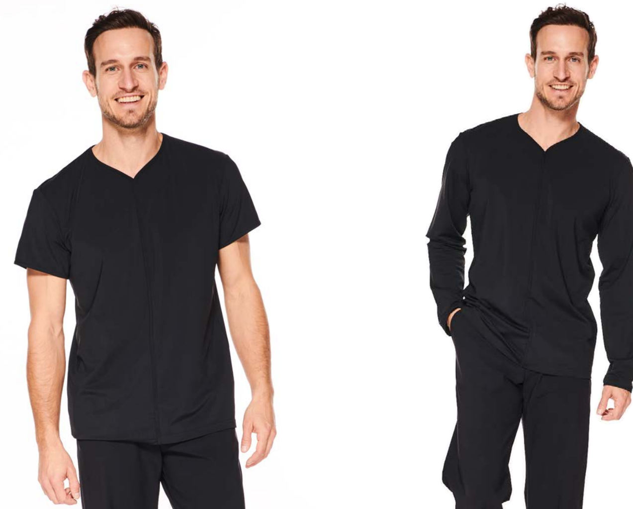
Shirt June, V-Ausschnitt, kurz-/langarm