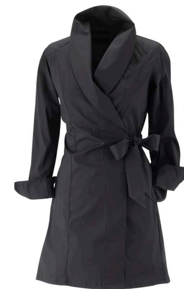
Wickelbluse Carol, Mitte Oberschenkel lang, Manschetten