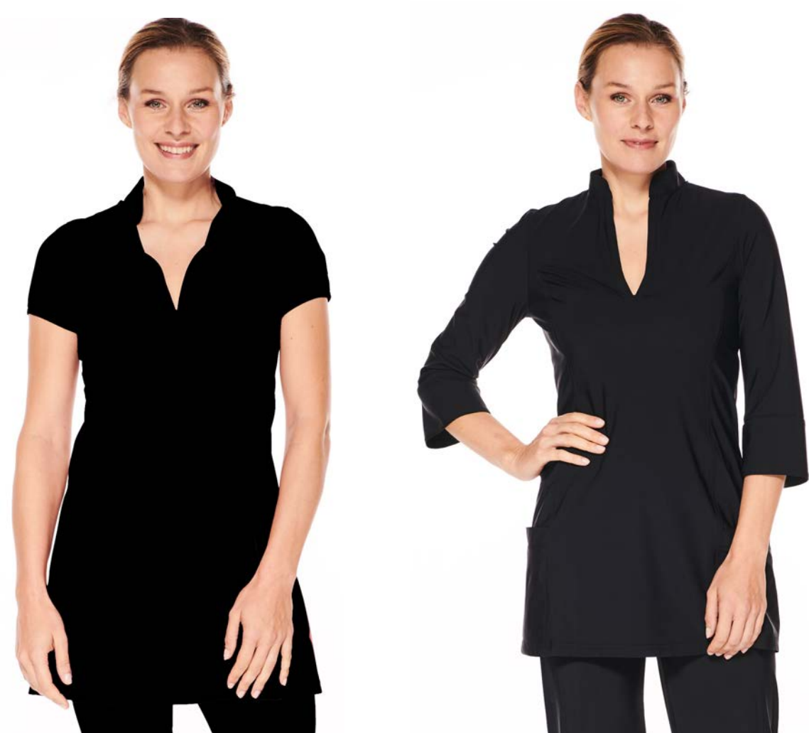
Tunica-Top Lychee, hüftlang, kurzarm