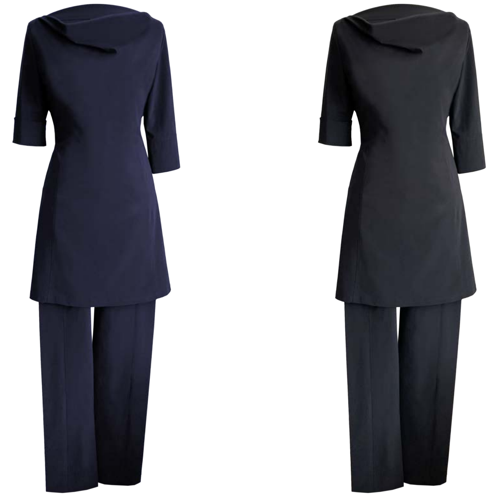
Flamenca Long-Top mit Wasserfall-Kragen, 2/3 und kurzarm zugleich, Hose Nina mit einer Tasche