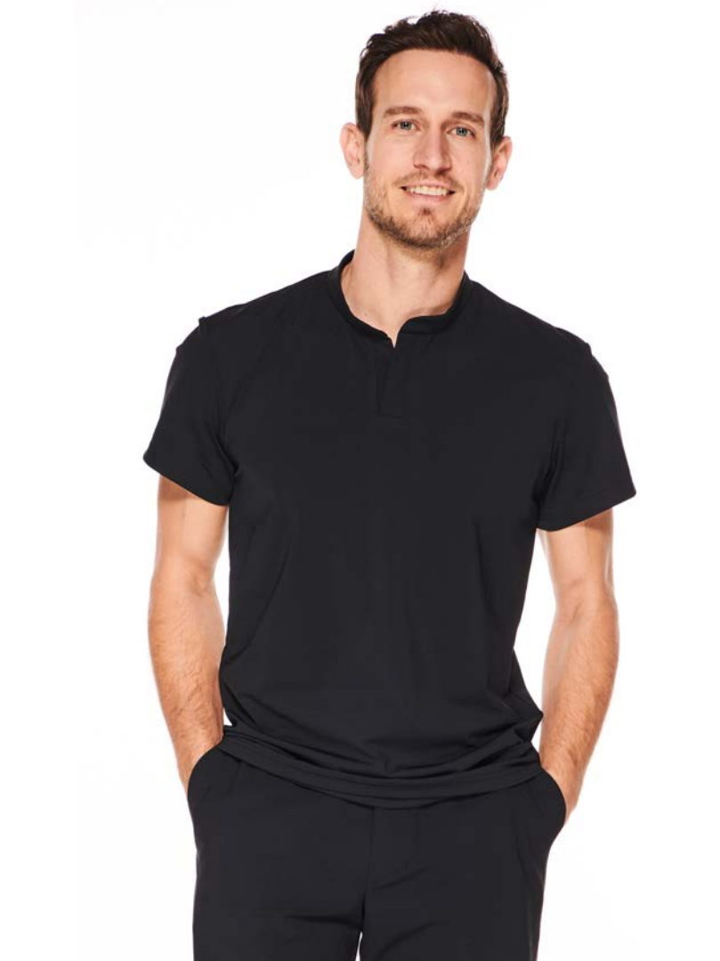
Shirt Lychee, Stehkragen, kurz-/langarm