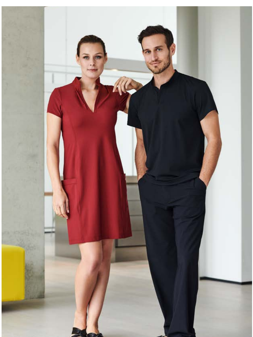
Tunica-Kleid oder Top Lychee, knielang, hüftlang, kurzarm, 3/4 arm