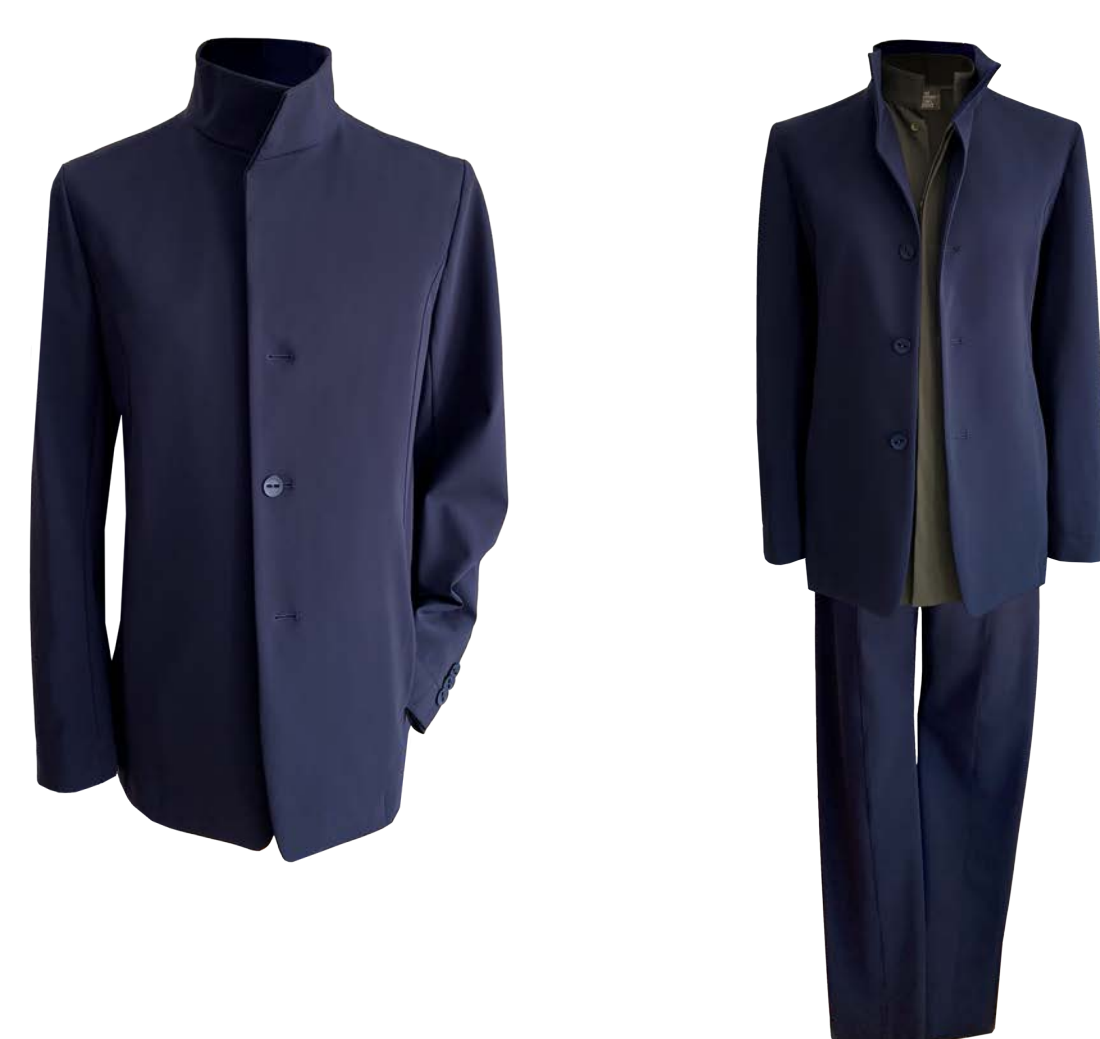
Veston James, Stehkragen, Taschen, Hemd Sam, Hose Blake