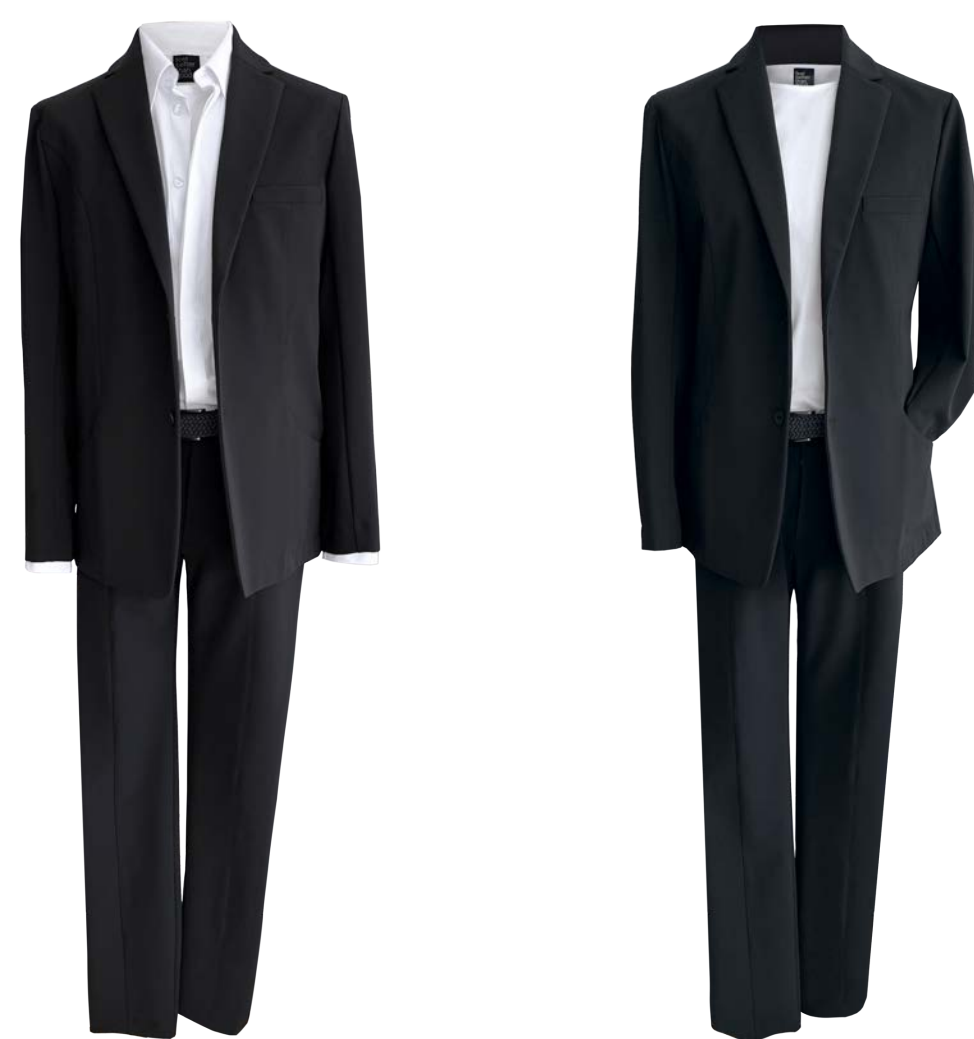
Veston Jack, Reverskragen, Taschen, Pochette, Shirt Sage, Hemd Max slim-fit mit button-down Spitzkragen, verdeckte Knopfleiste, Hose Blake