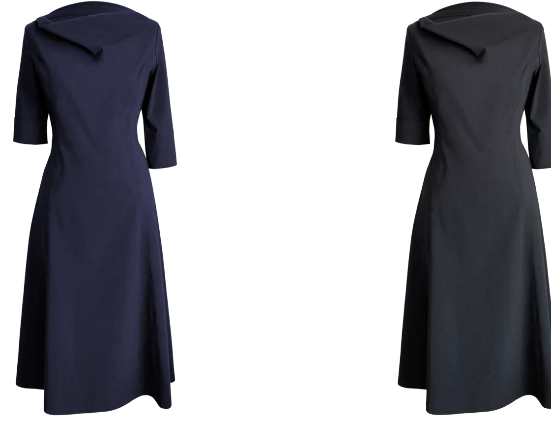
Das kleine Schwarze mit Wasserfall-Kragen, über ellbogenlang und kurzarm zugleich, Mitte wadenlang