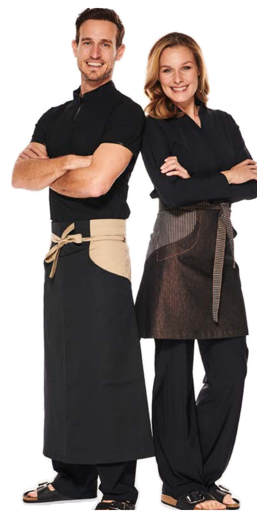
Mix Lychee & June