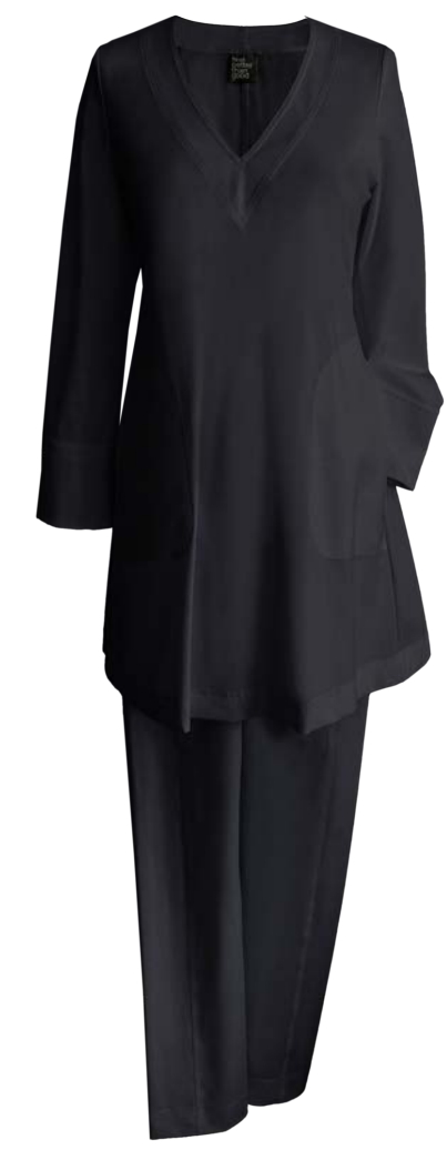
Tunica Ava, V-Ausschnitt, seitliche Taschen, Hose Twiggy