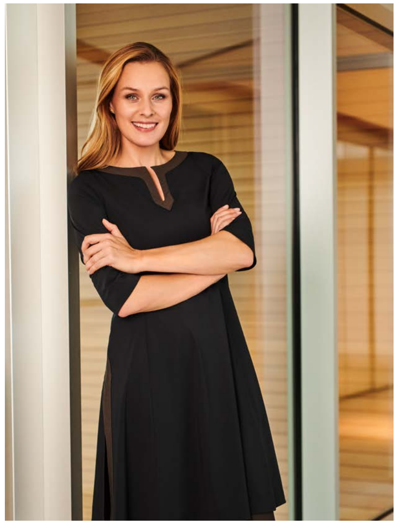
Tunica-Kleid Jasmine, schmeichelnd ausgestellt, seitliche Taschen, mit Hose Twiggy