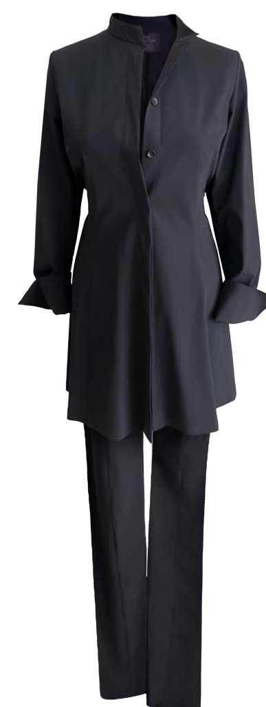
Bluse Claire India mit Stehkragen, Hose Twiggy