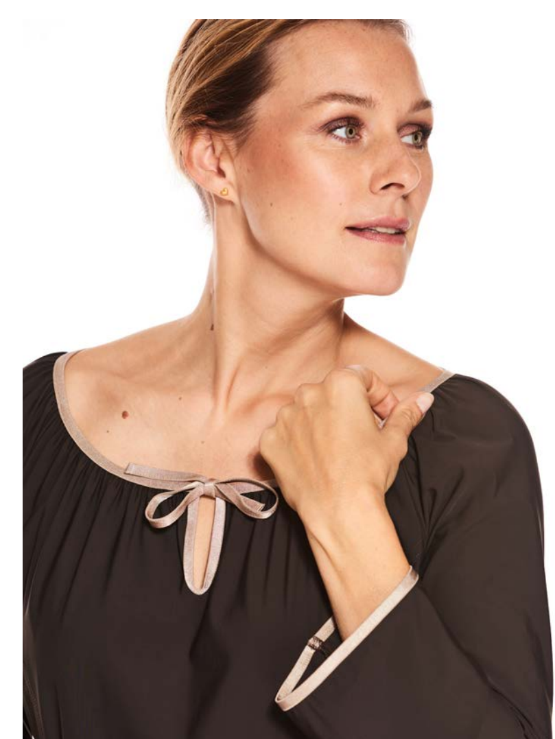
Dirndl-Top Heidi, hüftlang, langarm