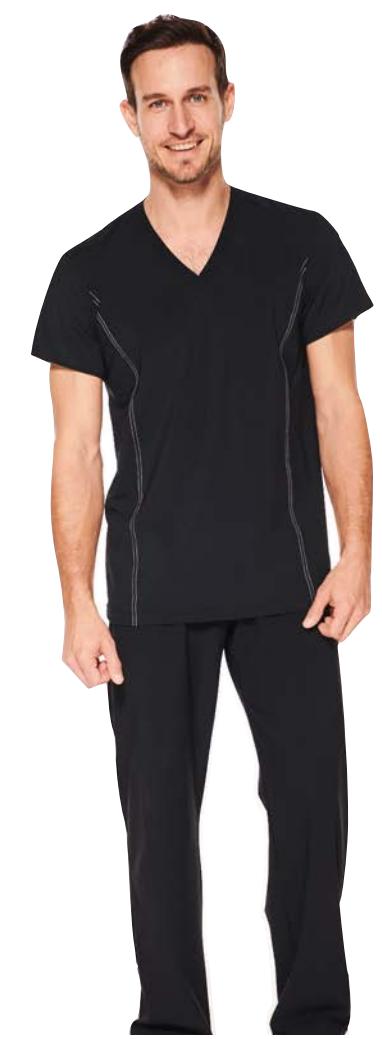
Jordan Polo kurz-/langarm, Shirts V-Ausschnitt lang-/kurzarm, slim-fit, Hose Cassis