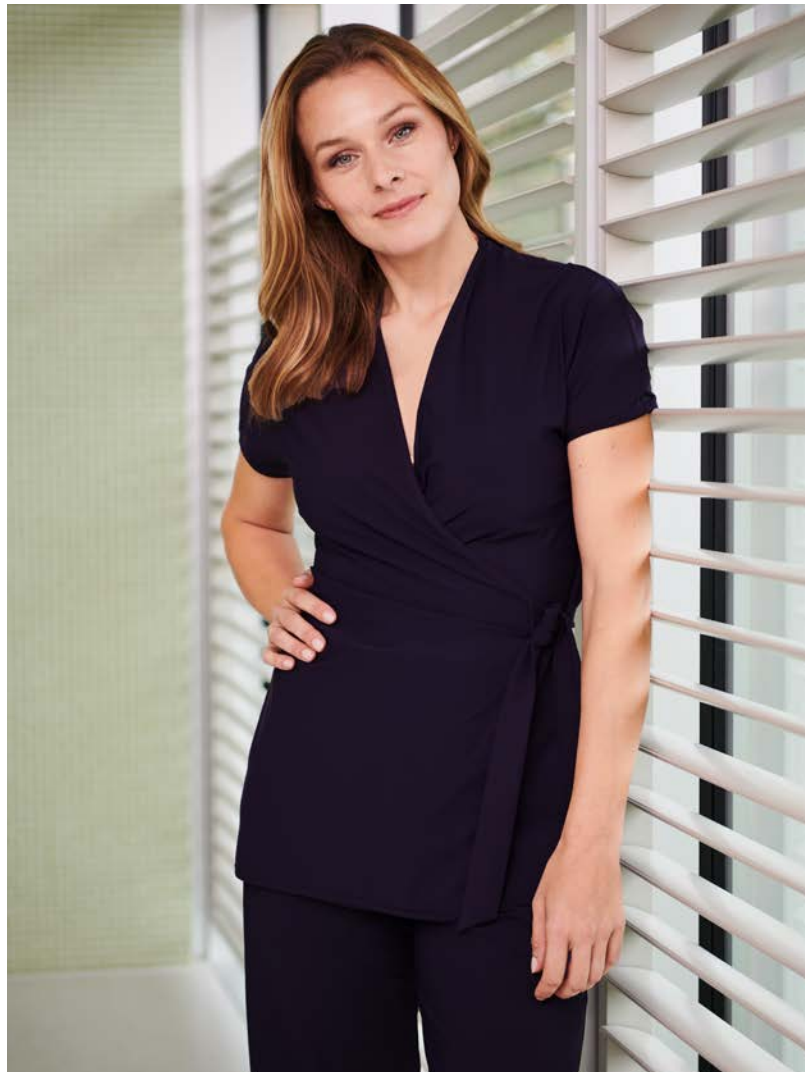
Wickeltop Coco hüftlang, kurz- und langarm, seitliche Tasche, auch Mitte Oberschenkel lang