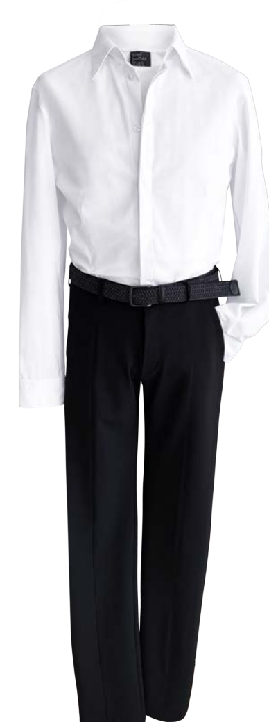
Slim-fit Max mit Spitzkragen, verdeckte Knopfleiste, Hose Blake