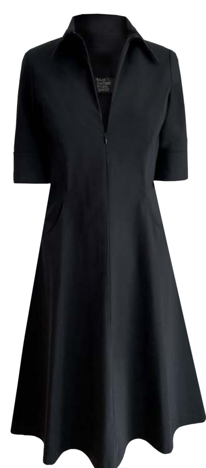
Shirtkleid Passion mit Reißverschluss Kurz-/Langarm, Spitz-/Stehkragen, seitliche Taschen, Überknie-Länge