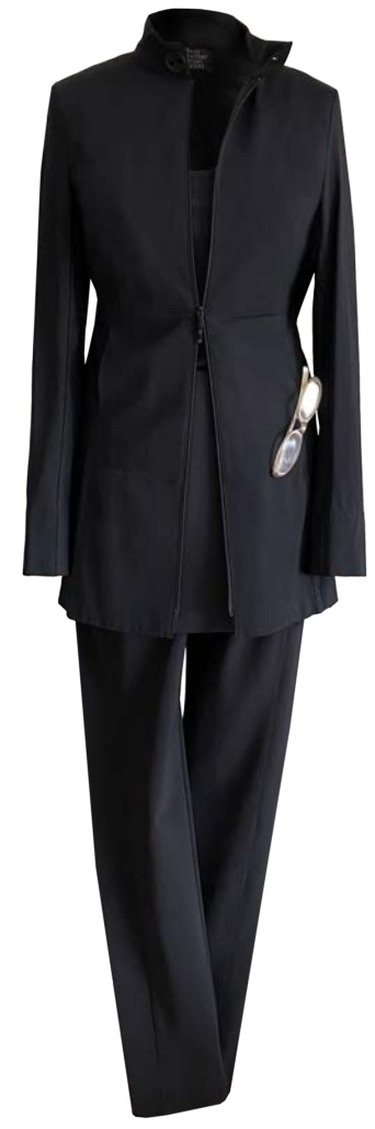
Biker Betsy, hüftlang, Reißverschluss, Stehkragen, seitliche Taschen, Hose Twiggy