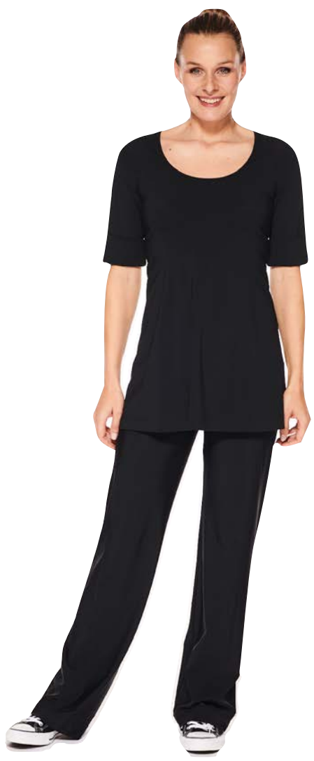
Top Luna, hüftlang, kurzarm, Hose Anais